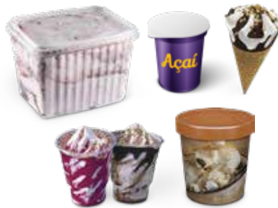
Some packing options Algunos tipos de envase