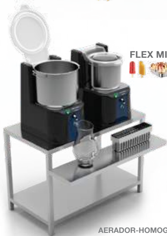
AERADOR-HOMOGENEIZADOR-DOSADOR 15 OU 25 LITROS

AERATOR BLENDER TO HOMOGENAIZE/DOSER 15 OR 25 LITERS