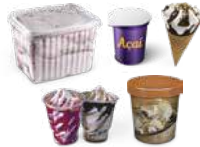
ALGUNS TIPOS DE ENVASE SOME PACKING OPTIONS ALGUNOS TIPOS DE ENVASES