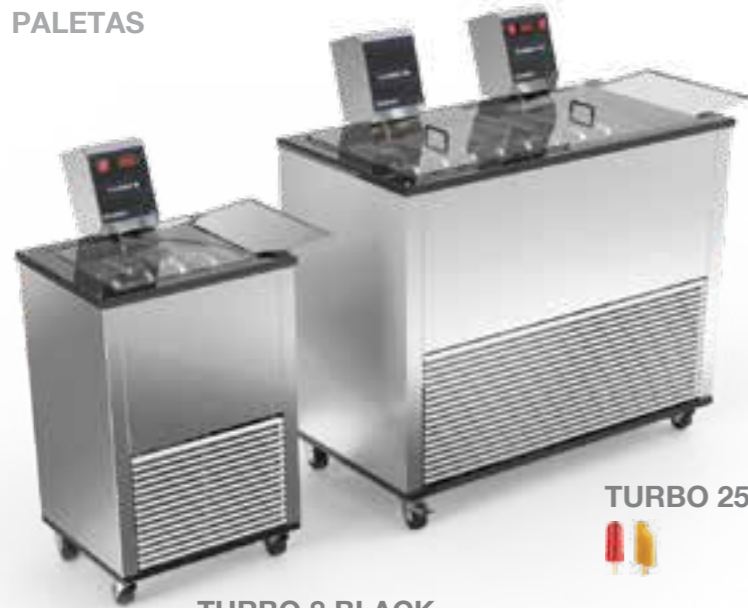
TURBO 8 BLACK

PRODUTORAS ARTESANAIS ARTISAN MACHINES FABRICADORAS ARTESANALES