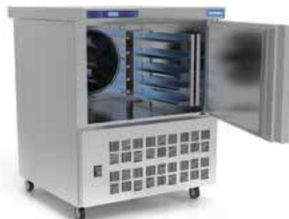
RESFRIAMENTO E CONGELAMENTO ULTRA RÁPIDO