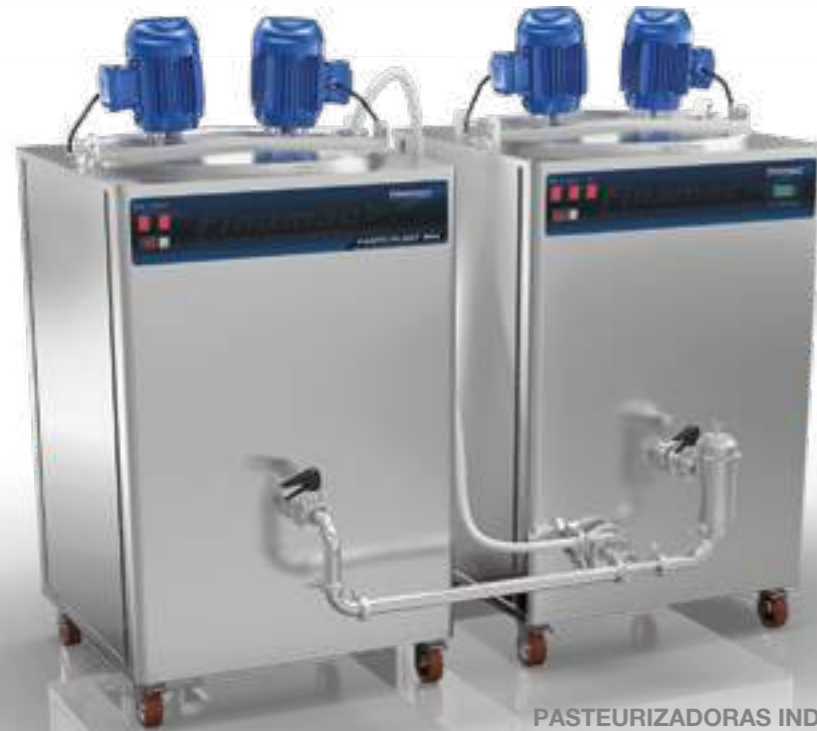
PASTO PLANT 300